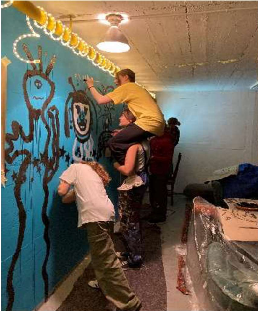
Picasso on the wall