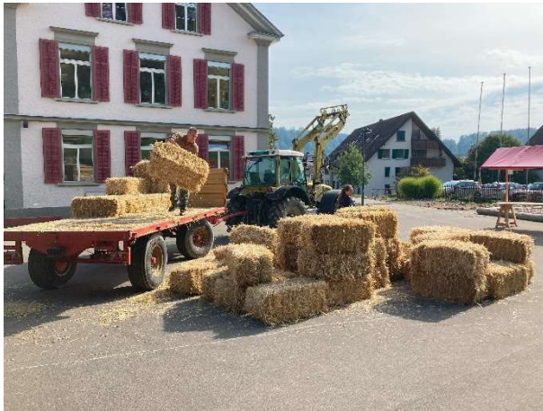
Monkey Cave Fest 2022